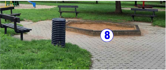
PÍSKOVIŠTĚ - BET.LEM š.250mm, v.250 mm