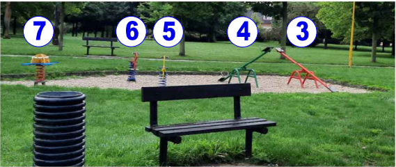
VAHADLOVÉ HOUPÁČKY- 2 ks PRUŽINOVÁ HOUPADLA - 3 ks